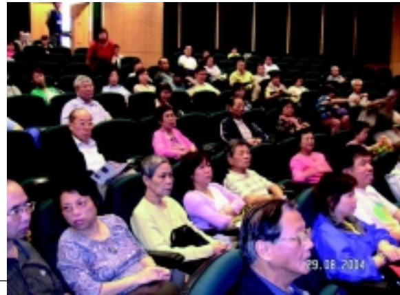
大家聽得津津有味

至於2005年度的公開講座，將會於下期會訊內公佈，關注糖尿病的朋友們記緊留意啦！